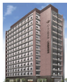
ハートンホテル心齋橋長堀通 大阪市西区新町1-5-11