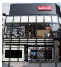
周防町スクエア 大阪市中央区西心齋橋 1-6-8