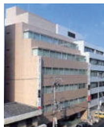
ニュー備後町ビル 大阪市中央区備後町 3-3-15