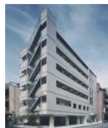
ケアビレッジ九条 大阪市西区九条