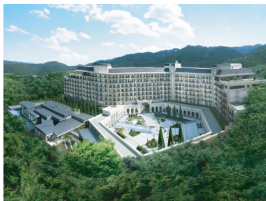
エクシブ有馬離宮