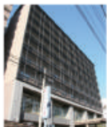
ハートンホテル京都 京都市中京区東洞院通 御池上ル