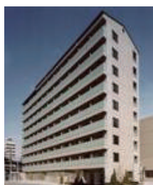
スチューデントハイム南堀江 大阪市西区南堀江 4-23-11