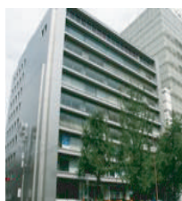
御堂筋ビル 関西トラスト本社社屋 大阪市中央区西心齋橋 1-4-5