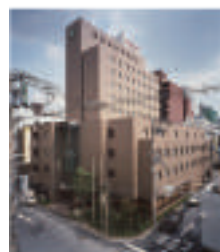
ハートンホテル心齋橋 本館 大阪市中央区西心齋橋 1-5-24