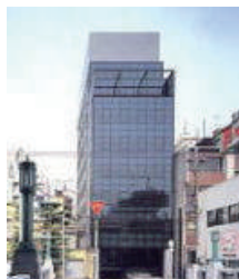
ニュー淡路町ビル 大阪市中央区淡路町 1-3-14