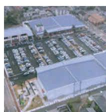
別府山の手ライフガーデン 別府市山の手町 8・9