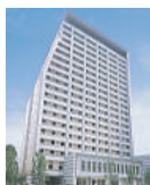
ハートンホテル東品川 東京都品川区東品川 4-13-27