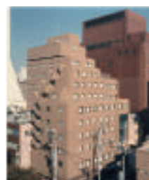
ハートンホテル心齋橋 別館 大阪市中央区西心齋橋 1-4-13