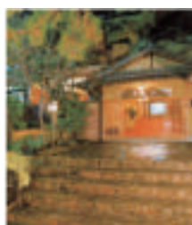
熱海大観荘 静岡県熱海市林が丘町7-1